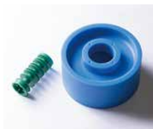
切削材料：MC ナイロン