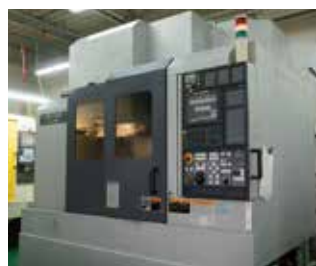
マシニングセンタ DMG 森精機