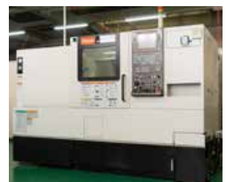
CNC 旋盤 マザック