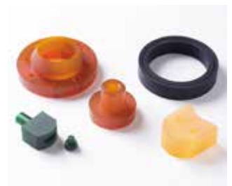
切削材料：各種ゴム