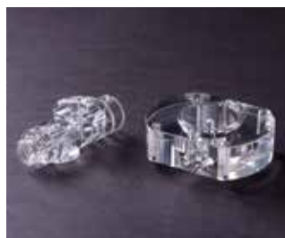
切削材料：アクリル＋鏡面仕上