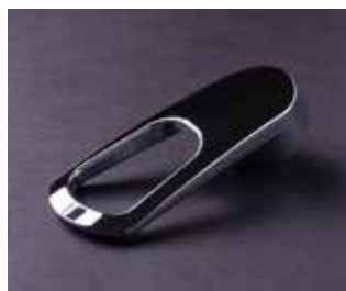
切削材料：ABS＋クロームめっき