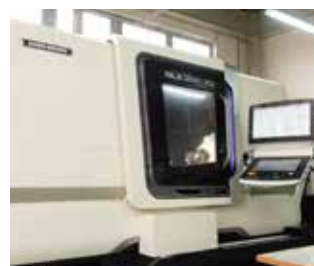
CNC 複合旋盤 DMG 森精機