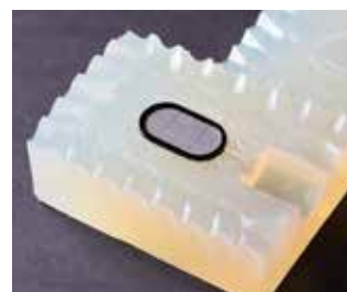
材料：真空注型＋塗装