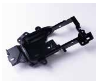
材料：造形加工＋塗装