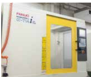
マシニングセンタ ファナック