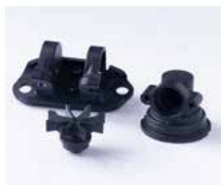
切削材料：PBT（ガラス入り）